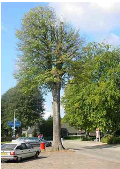
De lindeboom, waar Panken over schreef, is de huidige boom die midden op het Dorpsplein staat.

In 2001 is de boom boomtechnisch geïnspecteerd en er is toen een Tonderzwam aan de stamvoet geconstateerd. Bij het kandelabereren van bomen sterft namelijk ook een deel van het wortelstelsel af en wordt de boom gevoeliger voor aantasting door schimmels. Bomen met een dergelijke aantasting krijgen breekbare wortels en stam, waardoor de boom gevoelig wordt voor omwaaien. Door de boom regelmatig te knotten blijven de krachten op de boom en daarmee het risico voor omwaaien beperkt. De boom wordt jaarlijks gecontroleerd en in 2004 blijkt dat de boom nog voldoende groeikracht heeft, maar niet meer in dikte toeneemt. In 2007 wordt de kroon weer geknot om de krachten van de wind op de boom te beperken. Het komt er eigenlijk op neer dat de boom binnen enkele jaren, ruim een eeuw na het planten, het loodje zal leggen.