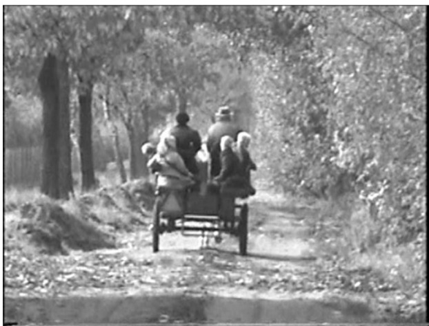
Mar bospaaikes houen we