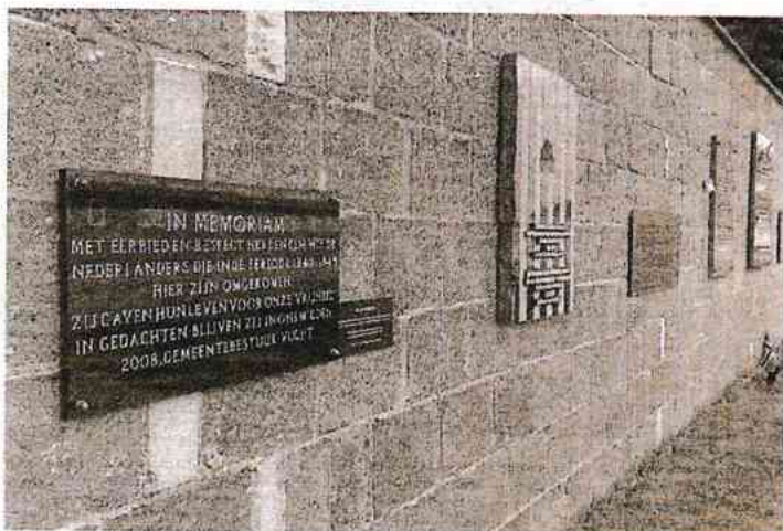
De Vughtse plaquette in Sachsenhausen, tussen de gedenkplaten uit andere landen.

De aldaar op 4 mei 2008 namens de gemeente Vught onthulde plaquette was een initiatief van de 'Stichting Vriendenkring Sachsenhausen'.