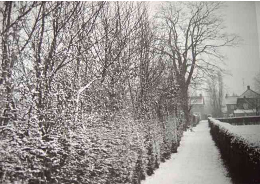
Ut Kerkpeike in 1960

Ut is moeilijk ut te legge hoe dà ge ut allemaol ut moet sprèke mar een ding is zeker ut gè over un wegske. Vruuger haode veul meer paaikes as dè ge dà nou zie, ze zèn haost allemaol verdwene in de loop der jaore. Hil vruuger liep ur un paaike vanaf de kerk naor dun hoek gè kwamt ongeveer nèffe Mie Plas. Ut paaike wier steeds meer gebrúkt dur de boere um naor de kerk en de winkel te gaon. Dûr waorre nog gin harde weeg in diéen tède. Ut paaike wier steeds brééer en toen gonge ze ur ut urste hous bouwe. Al gouw kwomme ur meer hous en toen ut Patronaat wier gebouwe hiette ut paaike vort Patronaatstraot. Loater toen de weg hard wier gemaakt moes de naam veranderd wòrre in Dokter Rauppstraot en dà is zo gebleve tot vandaog. De Patronaatstraot hai òk un stuk of 3 zijpaaikes, bè de kerk begòs ut al mee ut kerkpaaike dà op ut eind bè de Magneestraot Sengerspaaike hiette. Ut is sund dè ut ur nie hullemaol mir is want wie van de ouw garde hi daor nou nie mee un meidje in d'n tuin gehange. Mee de kermis moeste ooit un plèkske zien te vène zo druk waost ur. Hier zèn hil wà bergaikse huwelijke begonne of moete beginne.