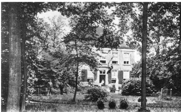
Het Domineeshuis van 1837