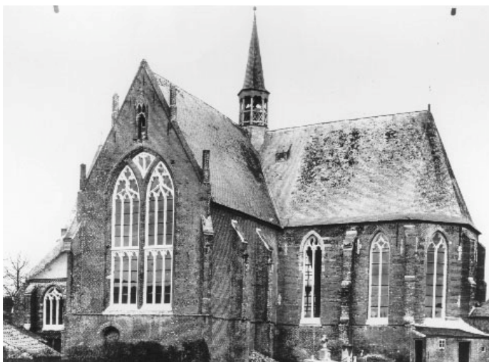
Kerk 't Hof 1888. Hagscheiding voor schoolgedeelte links, waarop ook het dak van 't knekelhuis zichtbaar is.

Tot zover de veranderingen in Panken z'n tijd.