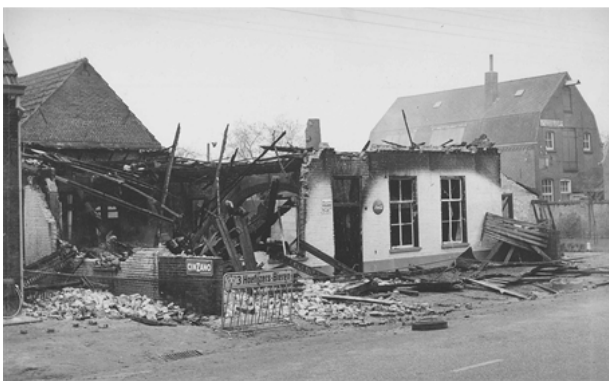
Uitslaande brand café De Postduif (nu: De Snor) van 2 maart 1957