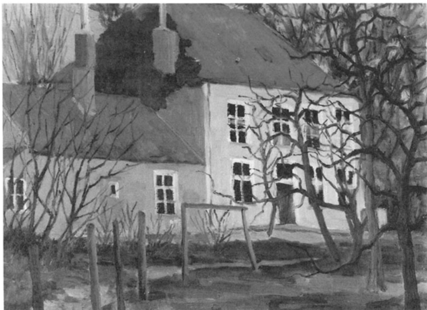
Achterzijde van Beukenhof