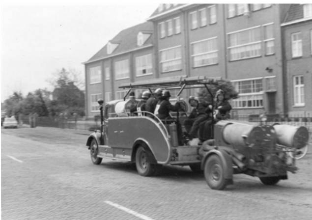
De brandweerwagen Bedford MCF van 1950