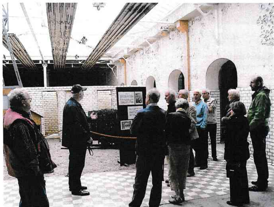
Leden van de Heemkundekring in de nog aanwezige badzaal

Via een power-point-presentatie werden de Bergeijkse gasten in de stemming gebracht, waarna de aanwezigen in twee groepen werden verdeeld. Het museum en de ondergrondse simulatie gaven ons vooral een goed beeld van datgene waarmee de mijnwerkers tot aan de sluiting in oktober 1989 werden geconfronteerd. Een 90-jarige geschiedenis (de eerste steenkool werd in 1901 uit de Kempische ondergrond gehaald), waarin duizenden mensen, vaak in stof en hitte badend, zoveel geld verdienden, dat zij bij de dreigende sluiting van de mijnen tot een ware revolutie werden opgezweept.