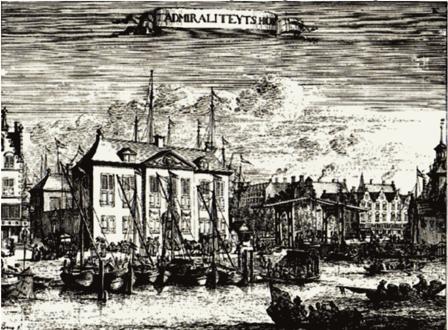
Admiraliteitshof of Zeekantoor van de Admiraliteit op de Maeze

In het besluit van 29 september 1662 besloten “De Gecommitteerde Raden Ter Admiraliteit, Residerende Binnen Rotterdam”, oftewel de Admiraliteit van de Maas te Rotterdam, om aan de grenzen palen te doen plaatsen.