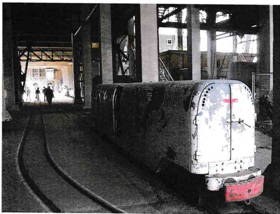
Het RodeKruis-treintje waarmee de gewonden werden opgehaald

Een groot deel van het Beringse mijnpatrimonium is behouden gebleven en is nu als monument beschermd. Gebrek aan geld confronteerde ons met het feit dat het nodige groot onderhoud nog steeds / lang op zich laat wachten. Zeer jammer, want de wandeling via het echte 'mijnwerkerspad', dat ons via de imposante badzaal, de persoonlijke kluiskastjes, langs de lampenzaal en de bezettingszaal tot aan de schachtbok voerde (waarlangs de mijnwerkers in de ondergrond afdaalden) was zeer indrukwekkend.