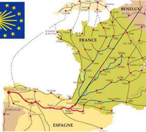
Routes naar Santiago de Compostella

wel eens een smokkelroute uit. De wandelroute is door de "pelgrims" gelopen via Nederland, België, Frankrijk en Spanje en beladen met een rugzak van ongeveer 18 kg. De inhoud betrof hoofdzakelijk reis-papieren, een beetje proviand, kleding en ander noodzakelijk goed om per se bij te hebben.