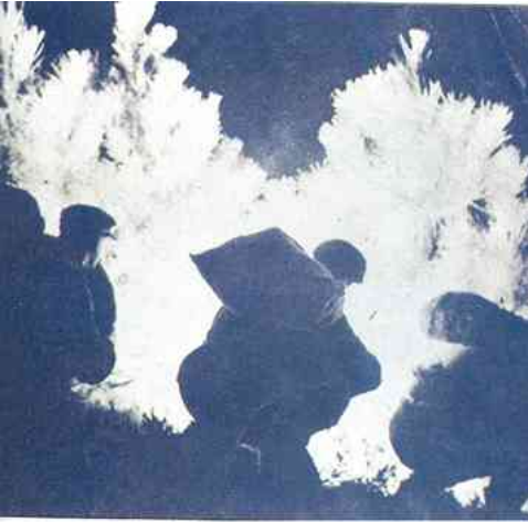
Pungelaars in de nacht

Toen we nog grenzen met grensbewakers hadden, hadden we ook smokkelaars. Ooit had smokkelen een romantische klank. De kleine smokkelaar uit de grensstreek, voor wie het smokkelen een 'sportieve' poging was het karige weekloon wat aan te vullen. Veelal met kleinschalige transport van boter, margarine of vloeitjes.