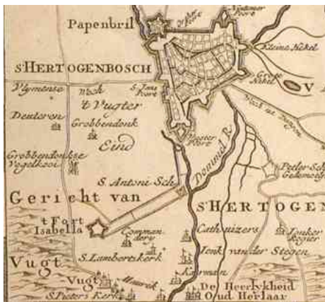
De ligging van Oud Herlaar