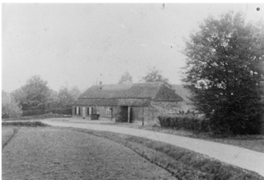
De eerste Boerenleenbank; Westerhoven

Na Westerhoven werden de Boerenleenbanken Bergeijk 't Loo met Weebosch, Luyksgestel, Bergeijk 't Hof en als laatste Boerenleenbank Riethoven opgericht. Het 100-jarig bestaan van de Rabobank in de gemeente Bergeijk is, wat datum betreft, door fusies en bankhandelingen gedefinieerd op 8 november 2011. De tentoonstelling in het gebouw van de Rabobank vertelt hoe het er begin vorige eeuw aan toe ging en toont de veranderingen tot nu. Ofwel van bankieren in een opkamertje van een café met geld in melkblikjes tot het huidige internet-bankieren.