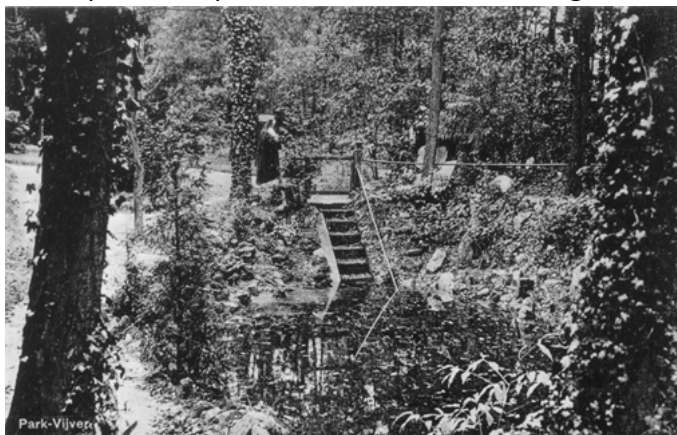
Wim van Dooremolen

Oh, ja, de kloostervijver: die ligt er ook nog, verstopt onder het gras.