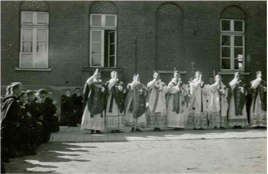
De gewijde Assumptionisten geven hun eerste zegen.

Het klooster kampte met dezelfde moeilijkheden als de buitenwereld, maar eenzelfde lot te moeten dragen brengt de mensen bij elkaar en ook klooster en bevolking vonden elkaar in die moeilijke dagen; de relatie tussen beide groepen groeide.