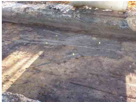
Sporen uit het verleden