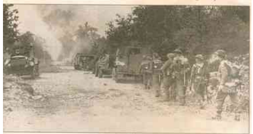
Op naar Valkenswaard