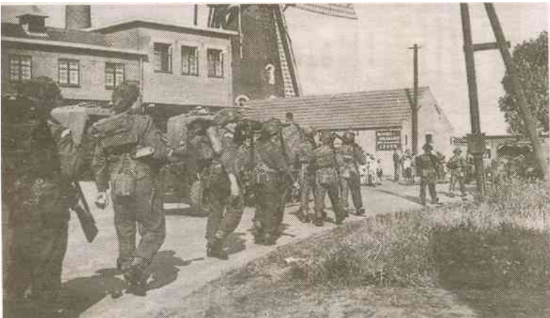
De bevrijders op Bergeijk 't Loo.

Gelukkig werd Bergeijk-dorp het oorlogsgeweld op 17 september bespaard.