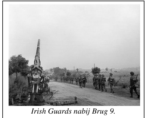
Irish Guards nabij Brug 9.

Tijdens die strijd waren geallieerde Irish Guards op 10 september in een omsingelende beweging via Eksel en Overpelt er in geslaagd brug nummer 9 in Lommel in handen te krijgen. Brug nr 9 over het Kempens kanaal (een Schelde-Maas verbinding) werd door de Guards o.l.v. J.O.E. Vandeleur veroverd en wordt sindsdien Joe's Bridge genoemd. Deze brug zou een week later als springplank voor Operatie Market Garden gebruikt worden.