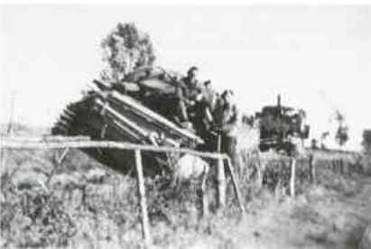
Bij een achtergelaten Duitse tank aan de Borkesed dijk.