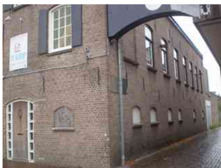
'Monaco', de in 1910 gebouwde sigarenfabriek

“In september 1944 werden we hier bevrijd van de Duitsers en bewoonden onze