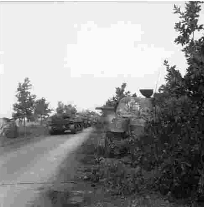
De colonne gaat verder de Luikerweg op.

opmars zonder problemen te verlopen, maar dat duurde niet lang. Na ruim 1 km vielen zij in een hinderlaag van de Kampfgruppe Walther, waarvan wonder boven wonder veel militairen in hun schuttersputjes langs de weg het vernietigende bombardement van de geallieerde artillerie en de luchtaanvallen met raketten door de Typhoons hadden overleefd. Majoor Kerutt en zijn mannen van de tankval