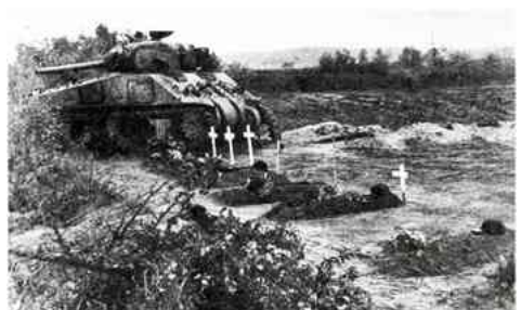
De uitgebrande tank opzij geschoven; de bemanning tijdelijk begraven.

Het werd al donker toen de eerste tanks in Valkenswaard de markt bereikten. Daar werd besloten om de opmars naar Eindhoven te stoppen en de nacht in Valkenswaard door te brengen. Het eerste oponthoud was een feit!