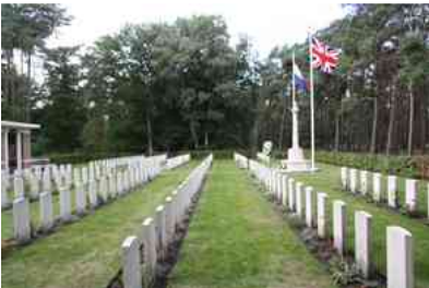
Oorlogskerkhof Valkenswaard, waar 220 Britse soldaten begraven liggen.