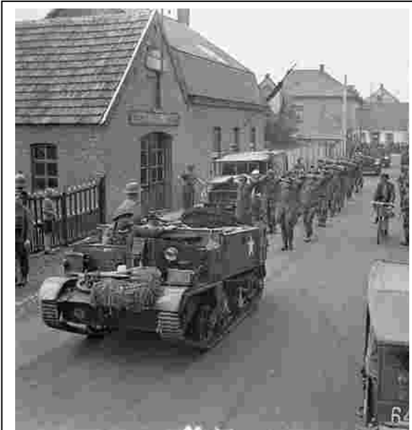
Gevangen Fallschirmjäger worden door de Welsh Guards afgevoerd.