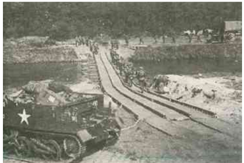
De aanleg van een noodbrug om het Kempens kanaal over te steken.

Op 18 september, begon de eigenlijke bevrijding van het dorp. De die dag geslagen noodbrug over het Kempens kanaal was daarbij van groot belang. Deze uit drijvende pontons bestaande noodbrug lag zo'n 50 meter westelijk van de op 12 september 1944 stuk gebombardeerde brug in de Gestelsedijk. De eerste verkenners waren op die maandagmiddag al gesignaleerd in de nabijheid van de Kruiskapel. Tegen de avond volgden de stoottroepen. Patrouilles van zo'n twintig Britse militairen van het 1st Ox en Bucks Regiment kwamen eerst op handen en voeten via de kiezelsloot langs de Lommeïse dijk gekropen, waarna spoedig de eerste jeeps volgden. Ook via de