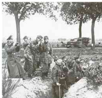
Fallschirmjäger graven zich in.

Dat oorlogsfront daar aan de grens, dat was op 12 september gemaakt; toen werd Duits oorlogsmateriaal richting grens verplaatst. Generaal Student had Fallschirmjäger gerecruteerd en Majoor Kerutt opdracht gegeven zich met antitankgeschut in de bossen in te graven. Samen met o.a. SS-Panzergranadiers, een bataljon dat Panzerjäger (een antitankwapen) bezat, werden aan twee zijden van de weg de geallieerden opgewacht.