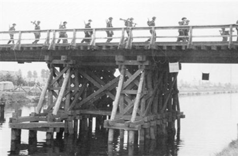
De Britten trekken over brug 9 van Lommel

Met de weg geblokkeerd gingen de tanks door de velden. Langs de Odilia hoeve die (linksachteraan op de rechtse foto) in brand staat.