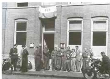
Partizanen Actie Nederland in Eindhoven- Willemsstraat

De Duitsers waren razend over de sabotage en over de verdwenen trein. Toen zij de wagons uiteindelijk, op 16 september, terugvonden, had de PAN de olielagers met zand en grind onklaar gemaakt, maar de Duitsers sleepten de trein toch terug naar het station, waar ze op 17 september klaar stond om naar Münster te vertrekken. De Ondergrondse had véél meer kunnen bereiken als ze de beschikking had gehad over meer wapens en springstof.