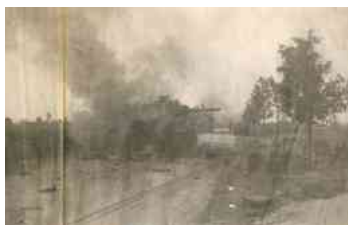
Brandende tanks aan de Luikerweg

Het Britse 30 E legercorps had de taak om, voor Garden, vanuit België Nederland binnen te trekken. Op 17 september 's middags om 14.45 uur reden hier de eerste Sherman tanks van de Irish Guards Nederland binnen op weg naar Arnhem. Dit nadat eerst een half uur lang een artilleriebombardement op de Duitse stellingen was uitgevoerd. Aanvankelijk leek de