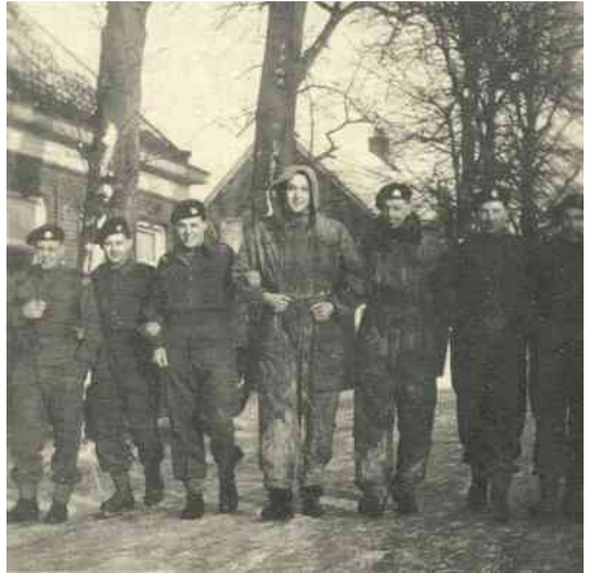
Tommies, wandelend in de Dorpsstraat