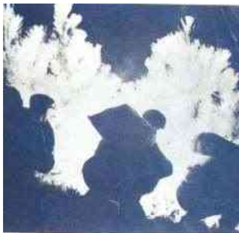
Pungelaars in de nacht