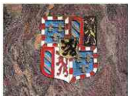
BERGEIJK, 550 JAAR STAD ZONDER MUREN

Redactie: info@heemkundekringbergeijk.nl Cas van Houtert, Jaap Bussing, Ad Tilborghs en Martien Veekens (tevens vormgeving en productie in samenwerking met Cees van Thoor)