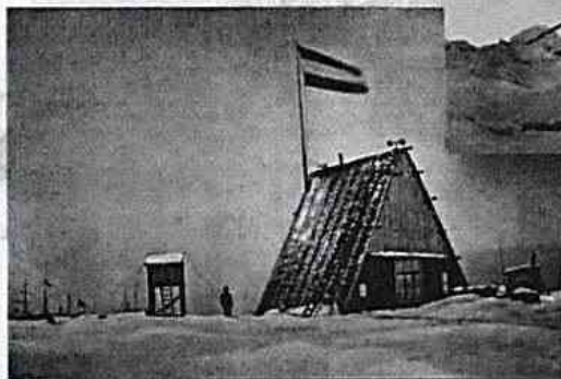
Het Nederlandse onderzoekkamp in maart 1883.