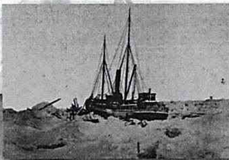
De Varna op 21 januari 1883 na de tweede hevige ijspersing.

Het doel van de expeditie was Port Dikson, gelegen aan de monding van de Jenisej. Daar zou een onderzoeksstation worden opgericht. Port Dikson werd echter niet bereikt. Het expeditie-schip kwam, samen met de Deense schuit Dymphna , muurvast te zitten in het ijs van de zuidwestelijke