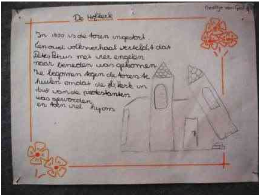
tijdens expositie 'Getekend Verleden' (Hofkerk, augustus 2016)